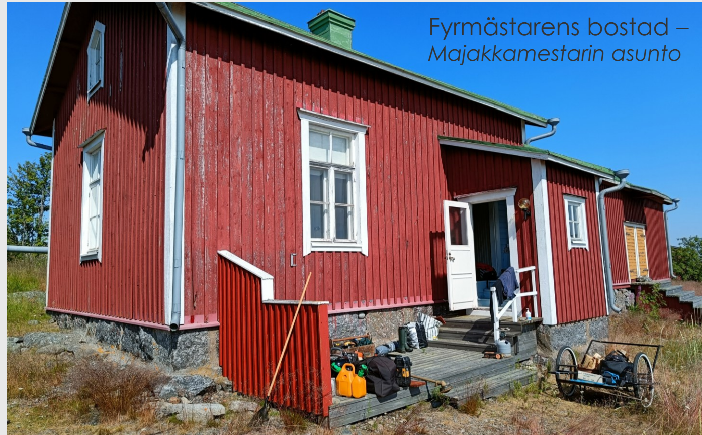
Fyrmästarens bostad – Majakkamestarin asunto