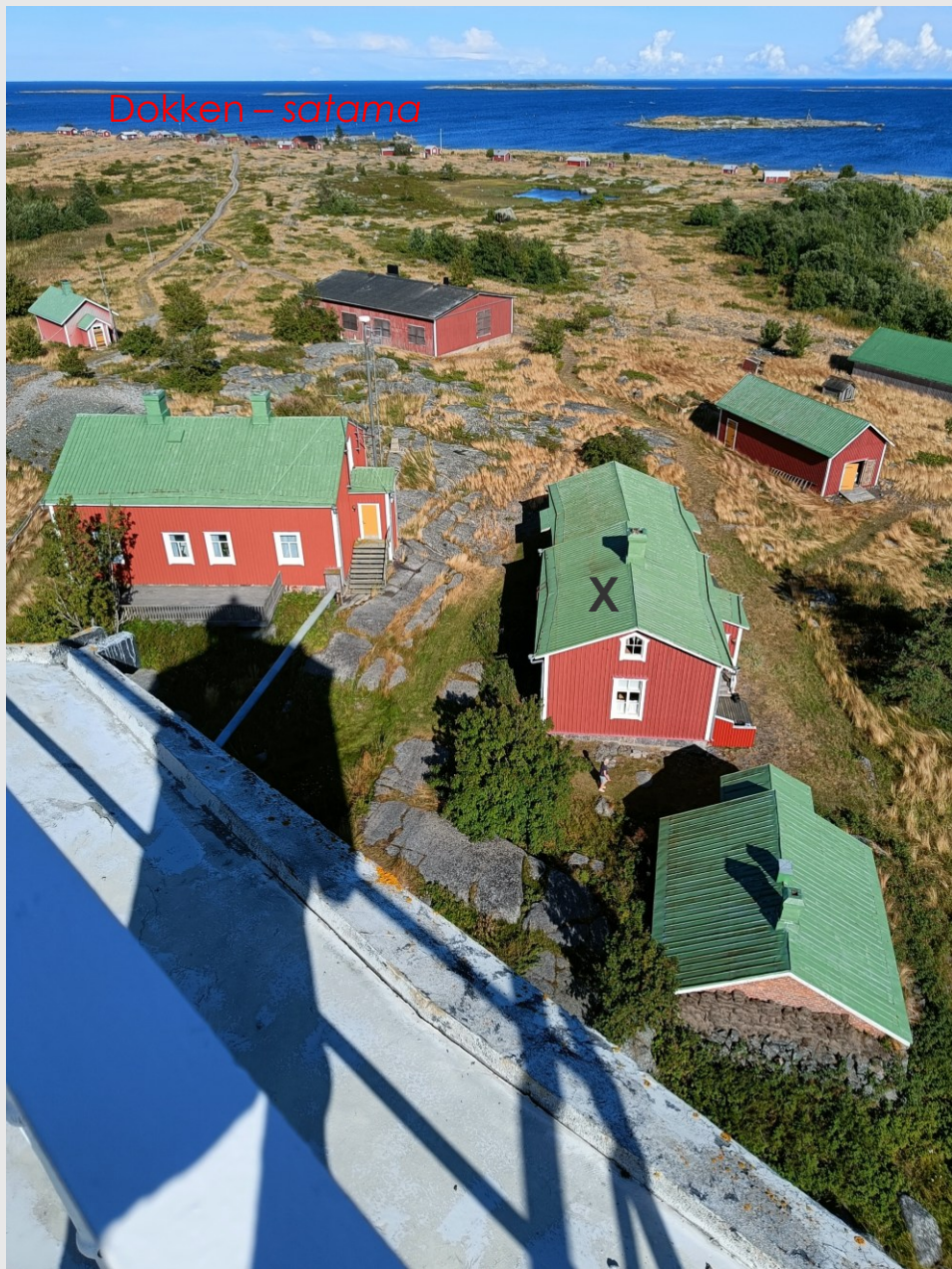
Norrskär sett från fyren – Norrskär majakasta katsottuna X=Fyrmästarens bostad – X=Majakkamestarin asunto